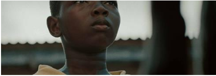
Da Yie (Buonanotte) di Antoni NtiGhana , Belgio – 2019, 21'

Prince è timido e riflessivo ma si lascia facilmente trascinare dalla vivace e impulsiva Matilda. I due bambini sono coinvolti in un'avventura che potrebbe distruggere per sempre le loro vite. Un grido accorato contro le centinaia di rapimenti di bambini che avvengono, ogni anno, in numerosi Stati africani, con un finale aperto alla speranza.