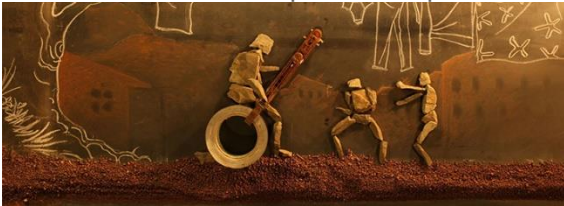
Machini di Frank Mukunday, Tétshim Repubblica Democratica Del Congo, Belgio – 2019, 10'

Prince è timido e riflessivo ma si lascia facilmente trascinare dalla vivace e impulsiva Matilda. I due bambini sono coinvolti in un'avventura che potrebbe distruggere per sempre le loro vite. Un grido accorato contro le centinaia di rapimenti di bambini che avvengono, ogni anno, in numerosi Stati africani, con un finale aperto alla speranza.