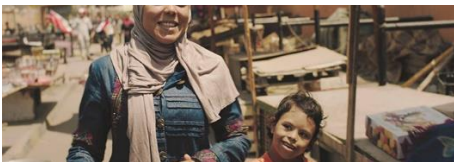
This Is My Night (Questa è la mia notte) di Youssef Noaman Egitto – 2019, 29'

In una cittadina ai piedi di un'industria mineraria, la vita quotidiana degli abitanti viene stravolta da un disastro ambientale preannunciato. Cortometraggio d'animazione che utilizza magistralmente la tecnica della stop-motion per denunciare l'inquinamento e lo sfruttamento umano e delle risorse in Congo, il Paese che detiene la più grande riserva mondiale di litio e cobalto.