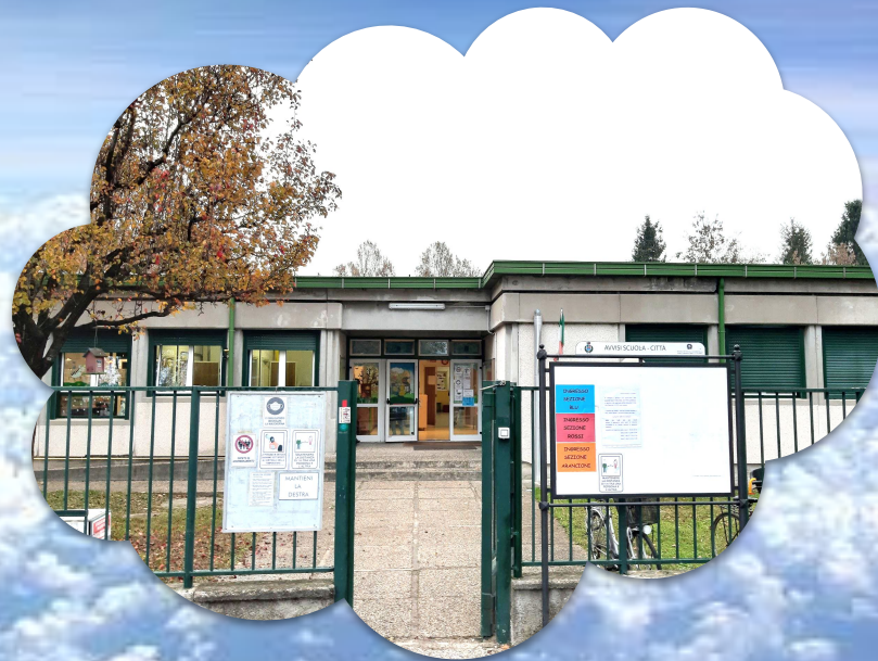
COLLODI Via Martiri di Via Fani