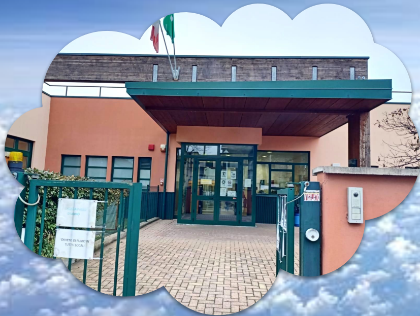
MONTESORI Via Verdi